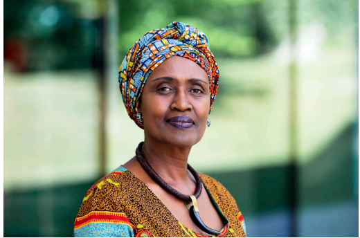
Mme Winnie Byanyima

Winnie Byanyima est Directrice exécutive de l'ONUSIDA et Secrétaire générale adjointe des Nations Unies. Depuis des décennies, elle défend ardemment les causes de la justice sociale et de l'égalité des sexes. Elle mène aujourd'hui l'action des Nations Unies afin de mettre un terme à l'épidémie de sida d'ici 2030. Elle est persuadée que les soins de santé sont un droit humain et elle figure parmi les premières personnalités à avoir exigé un vaccin pour tous et toutes contre le coronavirus, autrement dit un vaccin mis gratuitement à disposition dans le monde entier.