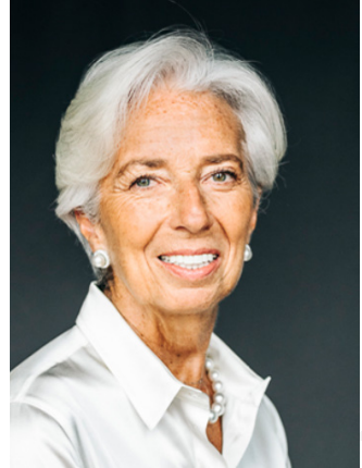
Mme Christine Lagarde